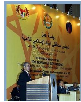
伊斯兰发展银行 (IDB) 会议